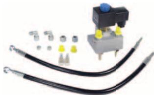
antipanikové zařízení* umožňuje pohyb ráhna v případě výpadku elektrické energie