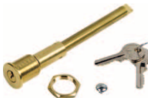
uvolňovací zámek s číslováním klíčem od 1 do 36