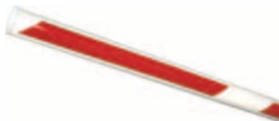
kulatá vyrážecí ráhna