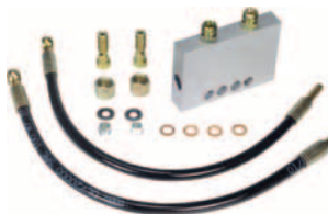
protivandalová ochrana hydroagregátu (*) ochraňuje hydraulický systém, pokud je vyvíjen tlak na ráhno