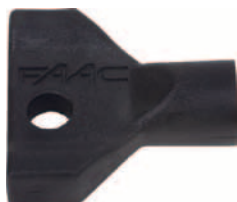
trojhranný klíč pro odblokování