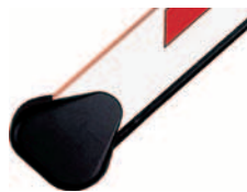
držák obdélníkového ráhna