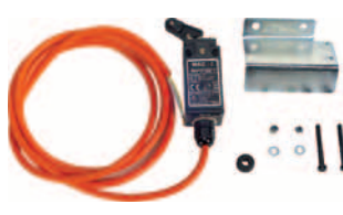
snímač vyrážení ráhna