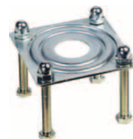
deska pro vidličkovou podpěru