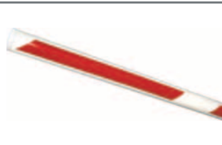
vyrážecí kulatá ráhna