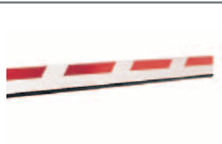
standardní obdélníková ráhna