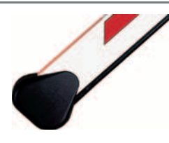
držák obdélníkového, kulatého a kulatého vyrážecího ráhna